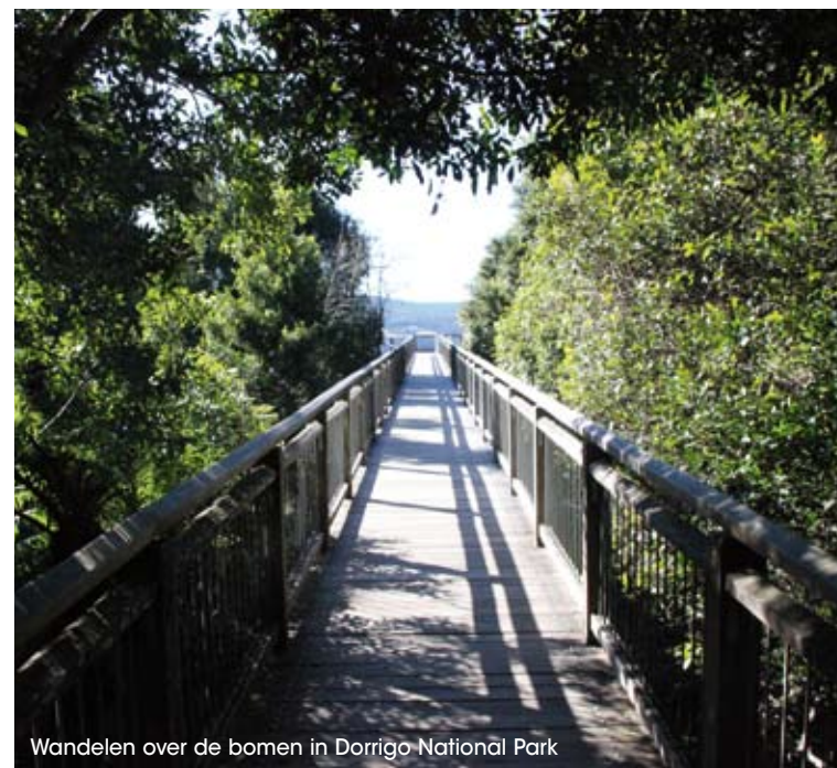
Wandelen over de bomen in Dorrigo National Park