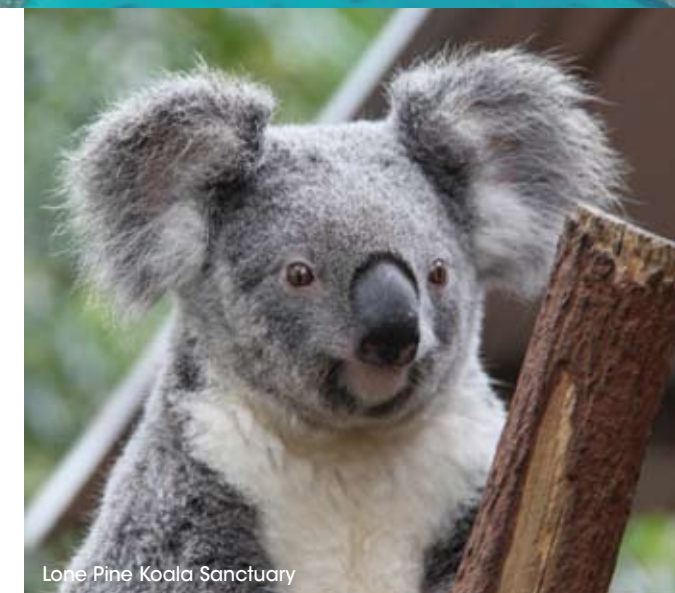
Lone Pine Koala Sanctuary

De rest van de praktische informatie vind je op www.genieten.be .