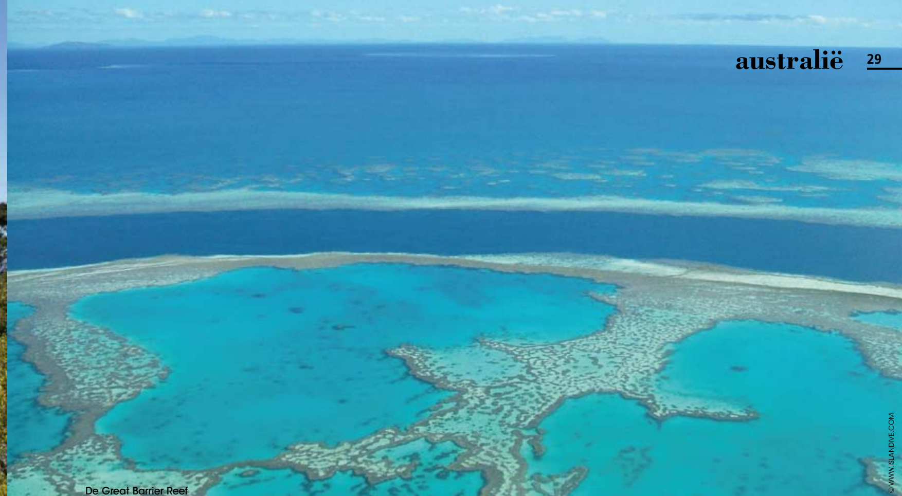
De Great Barrier Reef

In de namiddag volgt een cruise over de Daintree rivier en zien we een paar crocs die nog in de vrije natuur leven. Wijselijk houden we onze handen in de boot. Op onze laatste ochtend rijden we terug richting Cairns en nemen van daaruit de Skyrail Rainforest Cableway. De kabelbaan leidt ons over 7,5 kilometer tropisch regenwoud, met gi-